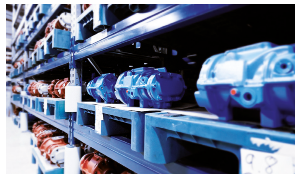
Stufenpool - Ihre Problemlösung mit 18 Monaten Gewährleistung

Vielseitige und zukunftsorientierte Servicelösungen für jeden Anwendungsbereich.