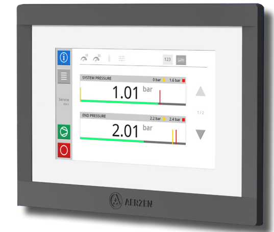
Das intuitive Touchpanel der neuen AERtronic