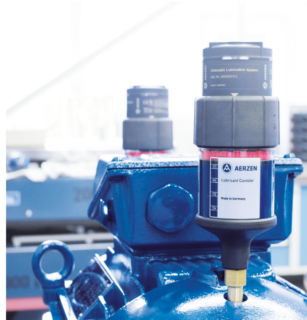
Minimiert das Ausfallrisiko – AERZEN automatische Nachschmiereinrichtungen

System Control: Nutzungsdauerbezogene Nachschmierung ohne Gefahr des Über- oder Unterfettens. Spannungsversorgung über vor konfigurierte und parametrisierte AERtronic. Ausgabe vor Störmeldung bei großer Viskosität oder leerer Katusche.