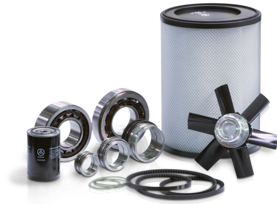
Ersatzteile von AERZEN. Qualität die sich bezahlt macht