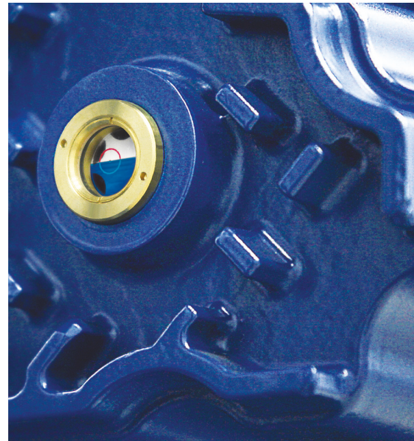
AERZEN Spezialöle sorgen für die richtige Schmierung