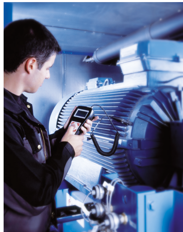
Professionelle Datenauswertung mit dem AERZEN Detector