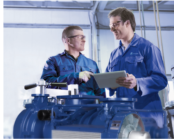
Schulungen sind der Schlüssel zum Erfolg

Die angebotenen Schulungen beziehen sich auf die AERZEN Standardaggregate: Delta Blower, Delta Hybrid und Delta Screw. Die Kurse sind praxisorientiert aufgebaut und umfassen auch das Aggregatezubehör.