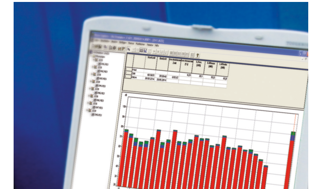
Schalltechnische Untersuchung mit 360 Grad-Blick

Wir führen schalltechnische Untersuchungen in der Planungs- und Projektierungsphase durch oder nehmen schalltechnische Optimierungen bei bestehenden Anlagen vor.