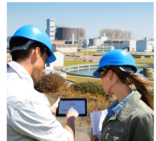
AERZEN WebView spart Kosten durch bedarfsgerechte Wartung