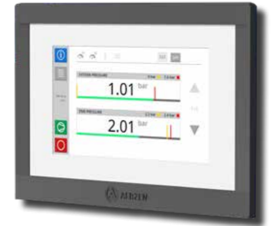
Das intuitive Touchpanel der neuen AERtronic