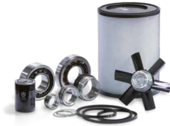
Ersatzteile von AERZEN. Qualität die sich bezahlt macht