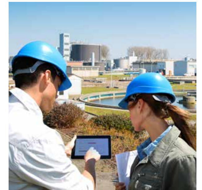
AERZEN WebView spart Kosten durch bedarfsgerechte Wartung

VIELSEITIGE UND ZUKUNFTSORIENTIERTE SERVICELÖSUNGEN FÜR JEDEN ANWENDBEREICH.