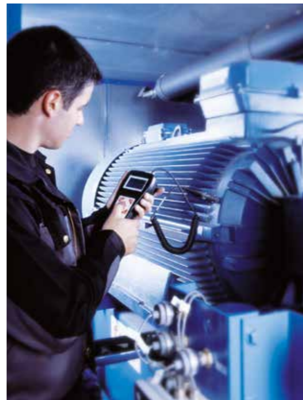
Professionelle Datenauswertung mit dem AERZEN Detector