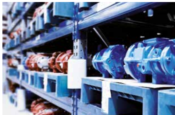
Stufenpool - Ihre Problemlösung mit 18 Monaten Gewährleistung