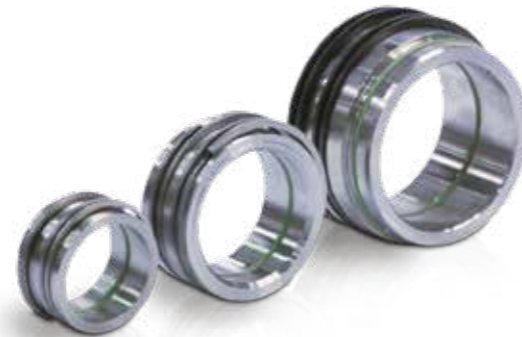
AERZEN Servicekit - immer eine gute Wahl

Sie sparen Zeit, Geld und minimieren Maschinenstillstände: Das Lieferprogramm umfasst ca. 1.000 verschiedene, sorgfältig zusammengestellte Kits mit genau den Teilen, die für die Wartung und Reparatur benötigt werden. Dabei wird jedes einzelne Kit auftragsbezogen zusammengestellt und verpackt. Schluss mit dem Durcharbeiten von Stücklisten, kein Ärger durch Fehlbestellungen bzw. -lieferungen.