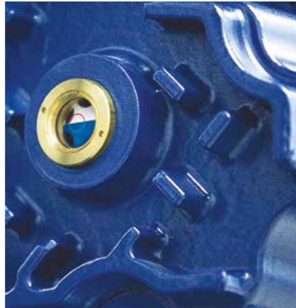
AERZEN Spezialöle sorgen für die richtige Schmierung