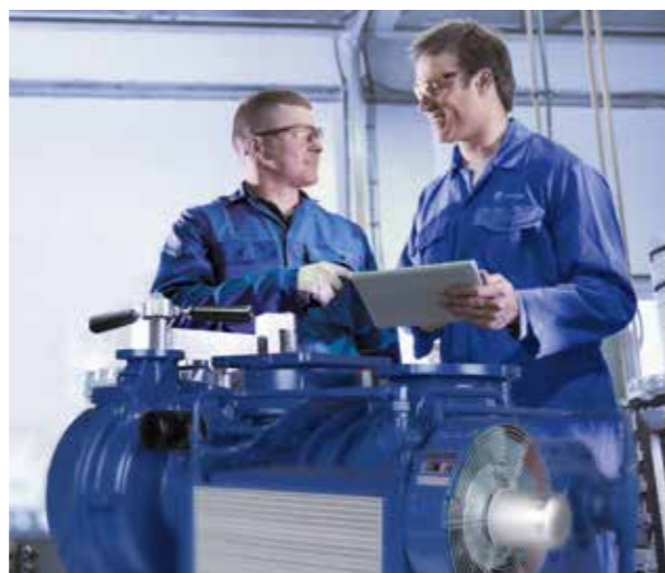
Schulungen sind der Schlüssel zum Erfolg

Die angebotenen Schulungen beziehen sich auf die AERZEN Standardaggregate: Delta Blower, Delta Hybrid und Delta Screw. Die Kurse sind praxisorientiert aufgebaut und umfassen auch das Aggregatezubehör.