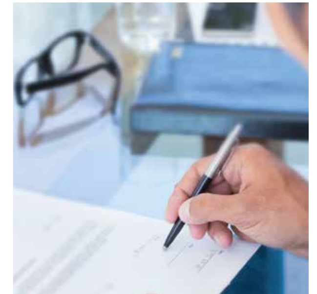
Maßgeschneiderte Serviceverträge von AERZEN

PROFITIEREN SIE VON UNSERER ERFAHRUNG UND NUTZEN SIE DIE VORTEILE DER AERZEN SERVICEWELT.