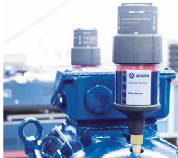
Minimiert das Ausfallrisiko – AERZEN automatische Nachschmiereinrichtungen

Nutzungsdauerbezogene Nachschmierung ohne Gefahr des Über- oder Unterfettens. Spannungsversorgung über vorkonfigurierte und parametrisierte AERtronic. Ausgabe vor Störmeldung bei großer Viskosität oder leerer Katusche.