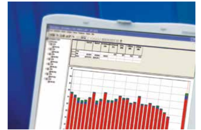
Schalltechnische Untersuchung mit 360 Grad-Blick

Wir führen schalltechnische Untersuchungen in der Planungs- und Projektierungsphase durch oder nehmen schalltechnische Optimierungen bei bestehenden Anlagen vor.